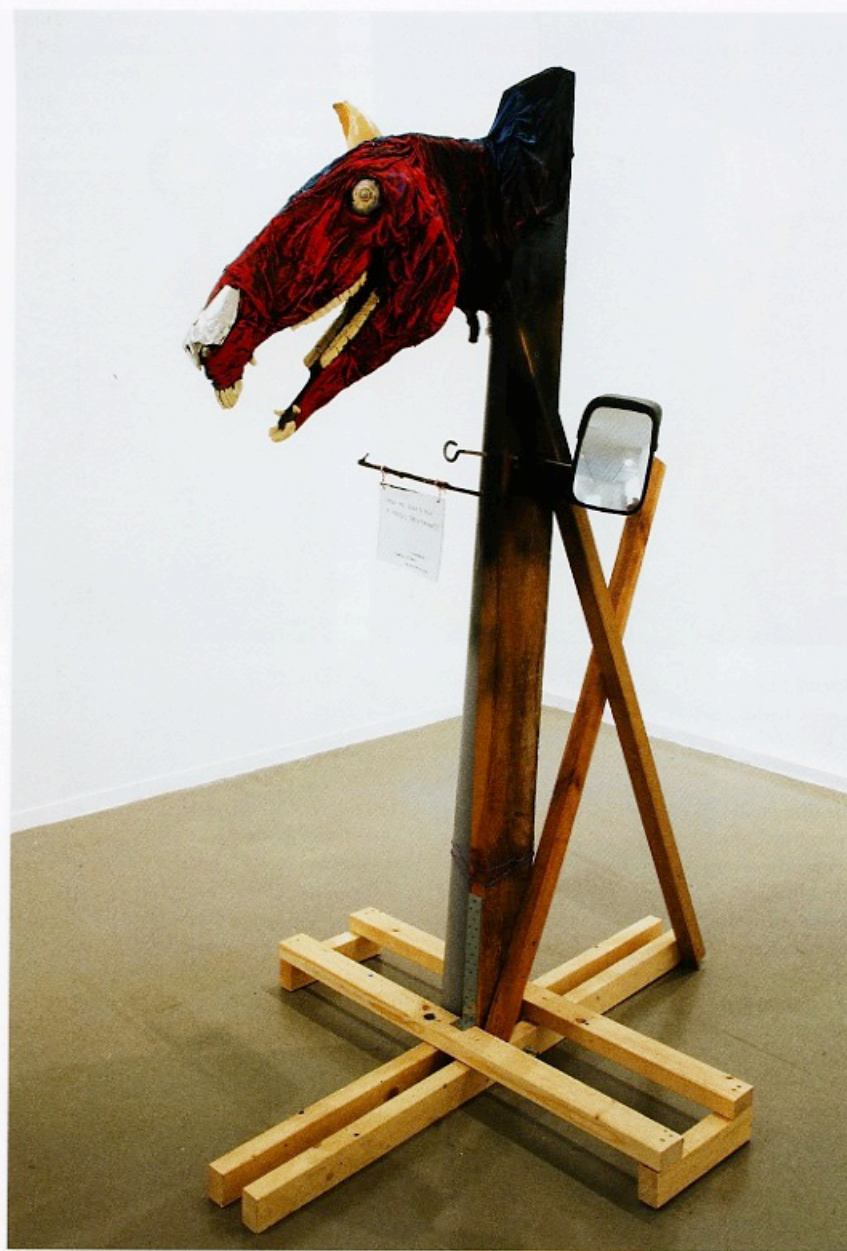
JIMMIE DURHAM, MULLHOLLAND DRIVE , 2007. horse skull, mixed media, 88 1/2 x 70 1/2 x 43 1/4" Pferdeschädel, verschiebene Materialien, 225 x 180 x 110 cm.

The work's critique is taken a step further through the display of an enlarged drawing credited to Adolf Hitler, a sketch for a monumental, oversize arch for the future Germania. A label written in Durham's hand offers a quote from Hitler: "The great evidences of civilization in granite and marble stand through the millennia. They alone are a truly stable pole in