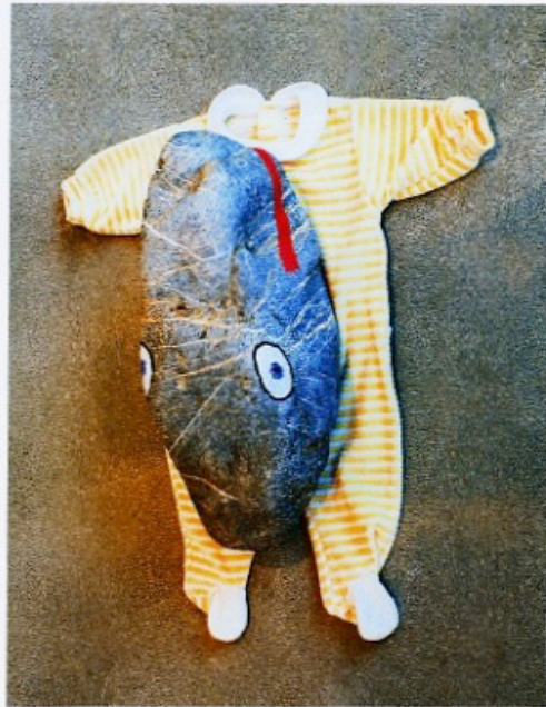
JIMMIE DURHAM, PIERRE SUR COTON , 2000, romper suit, river stone, acrylic, 8 7/8 x 19 3/4 x 17" / STEIN AUF BAUMWOLLE , Strampelhose, Flussstein, Acryl, 21 x 50 x 43 cm.