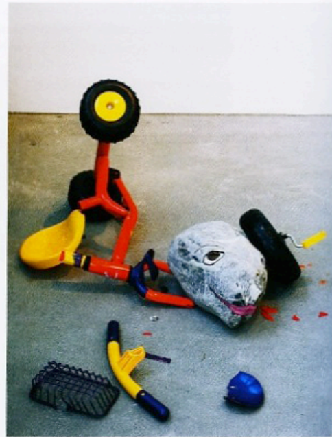
JIMMIE DURHAM, FIN DE LA SEMAINE , 2000, stone, tricycle, acrylic / ENDE DER WOCHE , Stein, Dreirad, Acryl.

the flux of all other phenomena." Nearby, a piece of concrete is mounted on a pedestal. This cylindrical object, product of a drill hole, is captioned DER PRÜFSTEIN (2012)—the stone of proof, the event that will put human aspirations to the test. In other words, it is the stone itself that will take the measure of us. We thus leave the field of negation and enter into a different, truly universal continuum. But this does not mean that now we are leaving the field of mirror effects. The work still holds up a mirror, but it is now no longer the civilizational complex that is the narcissistic measure and center of things. Rather, the mirror is universalized: Correspondences proliferate, not in order to affirm any identity but rather to open up the mimetic field—not toward some postmodern, unlimited pluralism in an endless play of signification but toward the plurality of material, biological histories in which we all take part.