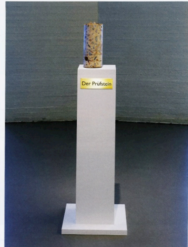
JIMMIE DURHAM, DER PRÜFSTEIN , 2012, detail of the installation "Museum of Stone" / DER PRÜFSTEIN , Detail der Installation "Museum of Stone".